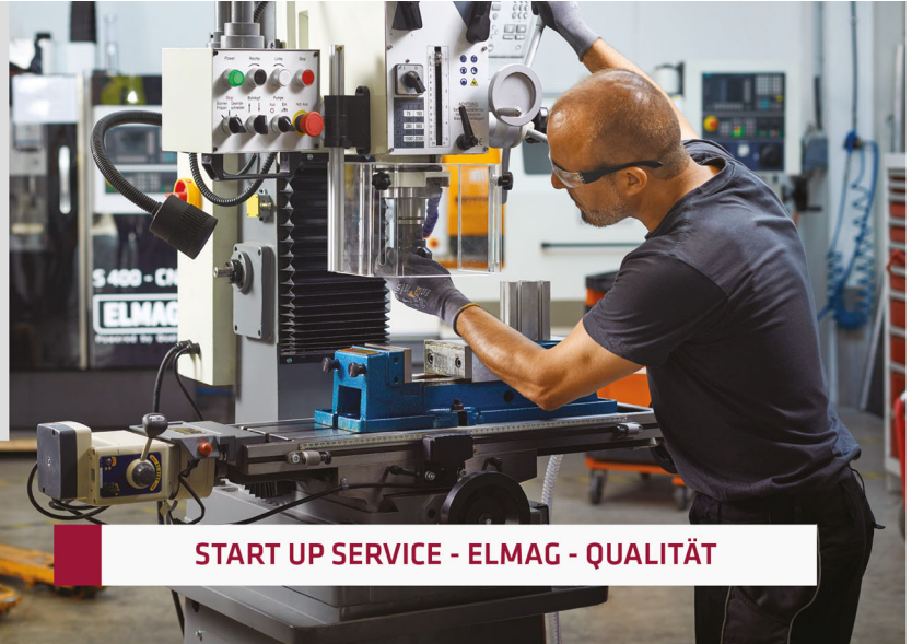
START UP SERVICE - ELMAG - QUALITÄT